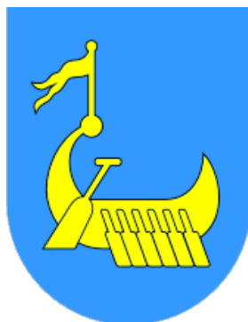
OBČINA ILIRSKA BISTRICA

Bazoviška cesta 14, 6250 Ilirska Bistrica