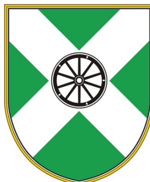
OBČINA HRPELJE - KOZINA

Bazoviška cesta 14, 6250 Ilirska Bistrica